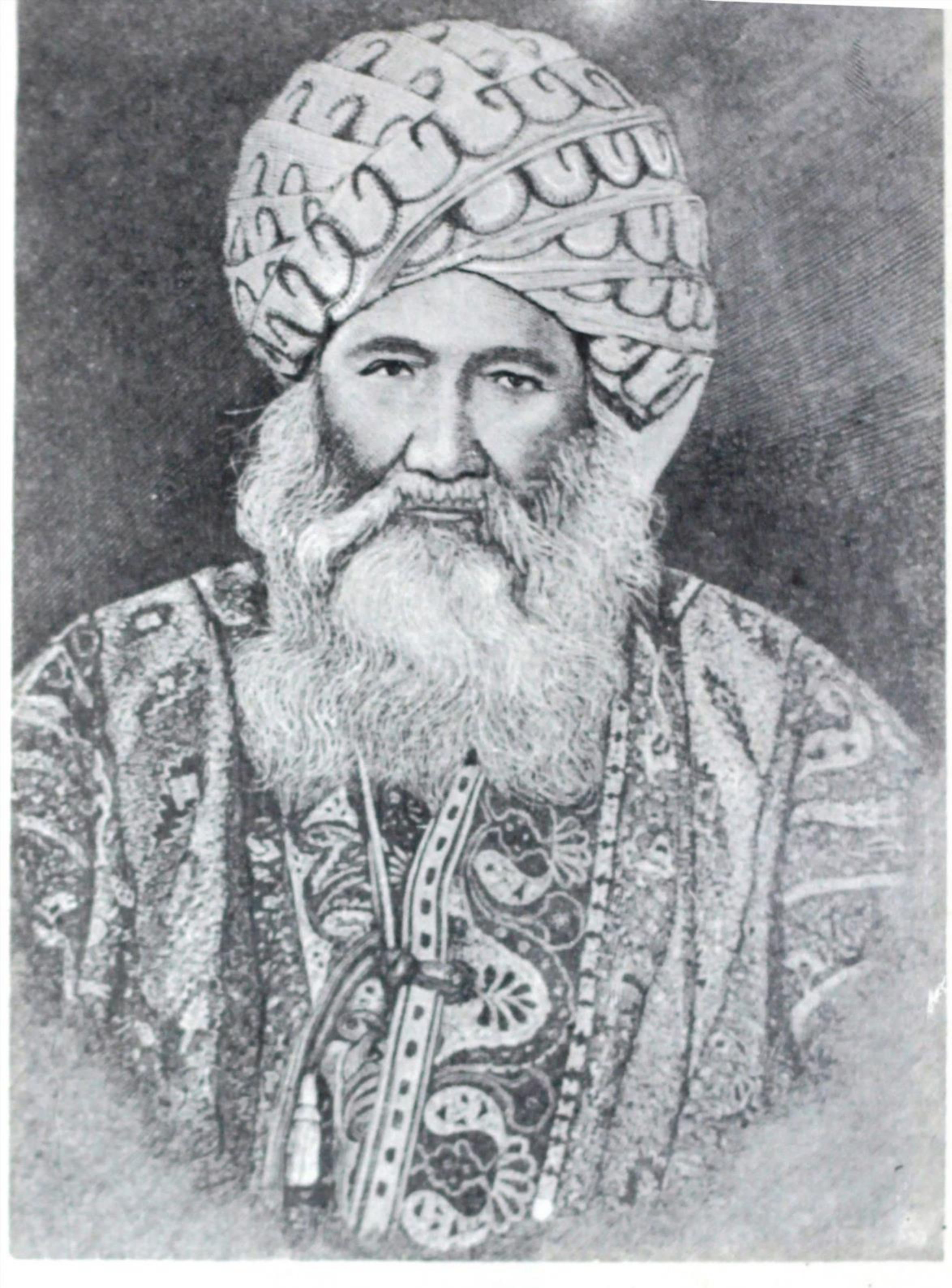
5. Кушбегин Бухоро Мулло Мухаммадбий (тасвири соли 1886).