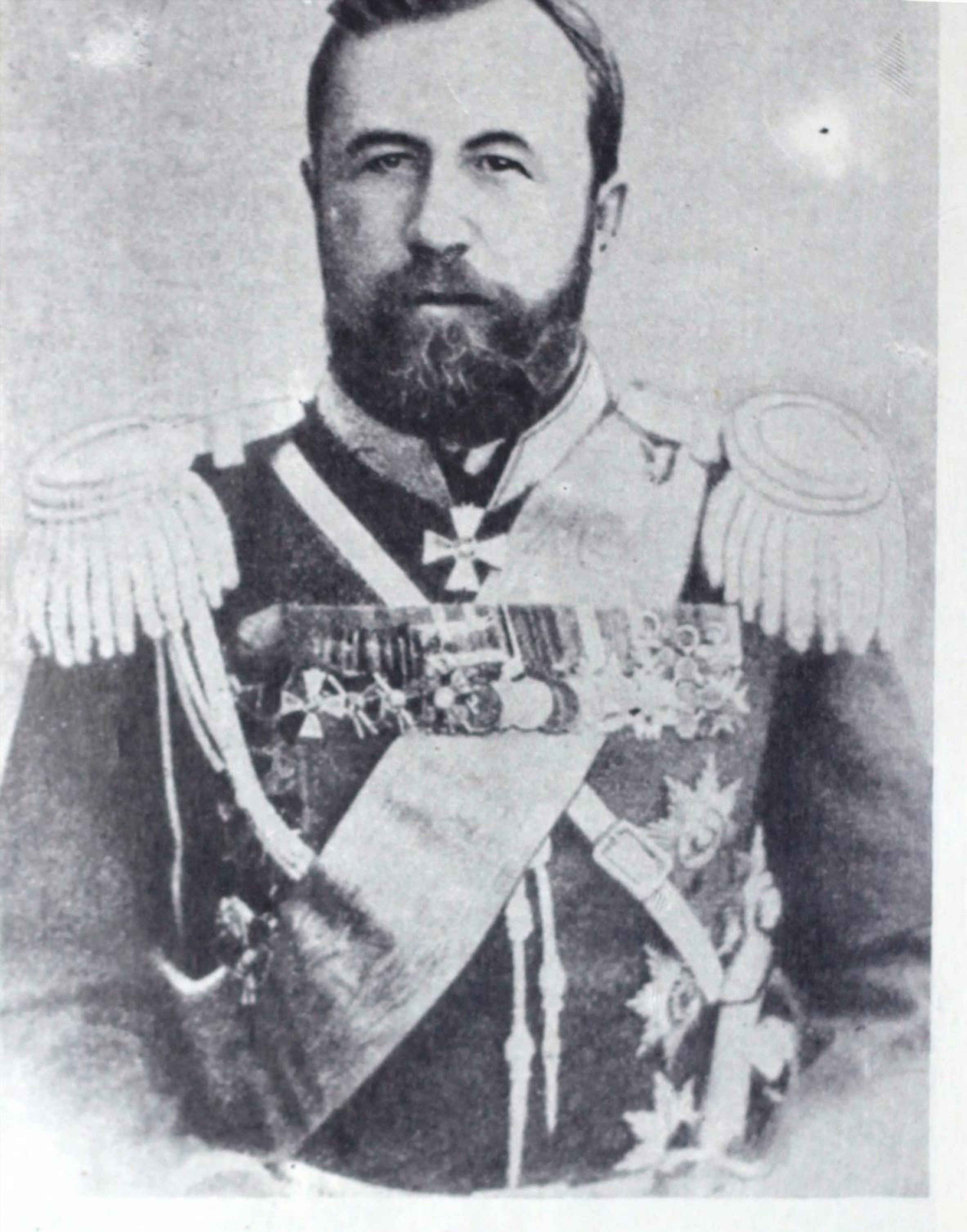
7. А. Н. Куропаткин, пахшкунандан шуриши Пулодхон дар Фаргона, баъдтар вазири харбии Россия.