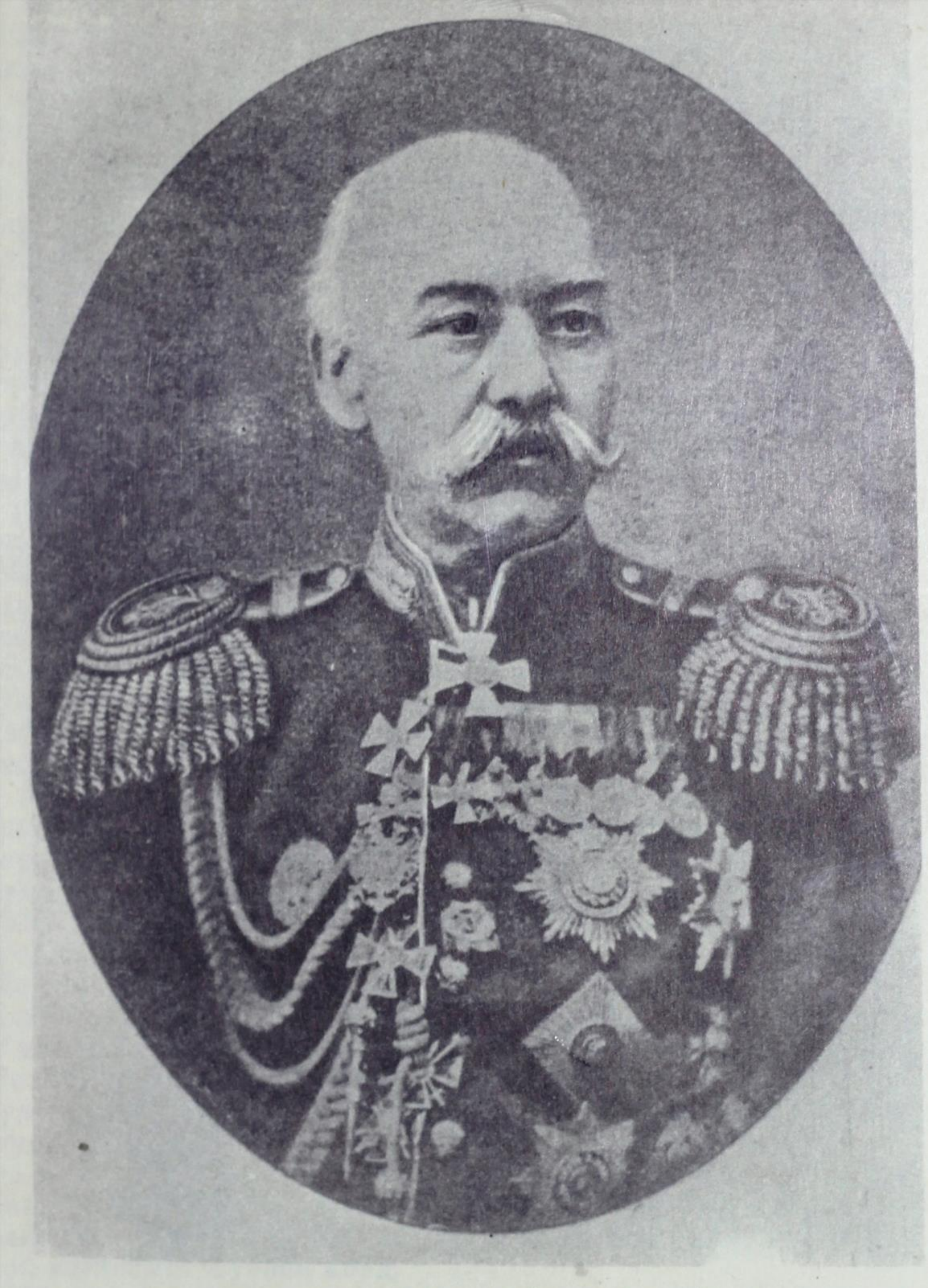
8. К. П. Фон-Кауфман, аввалин генерал-губернатори Туркистон