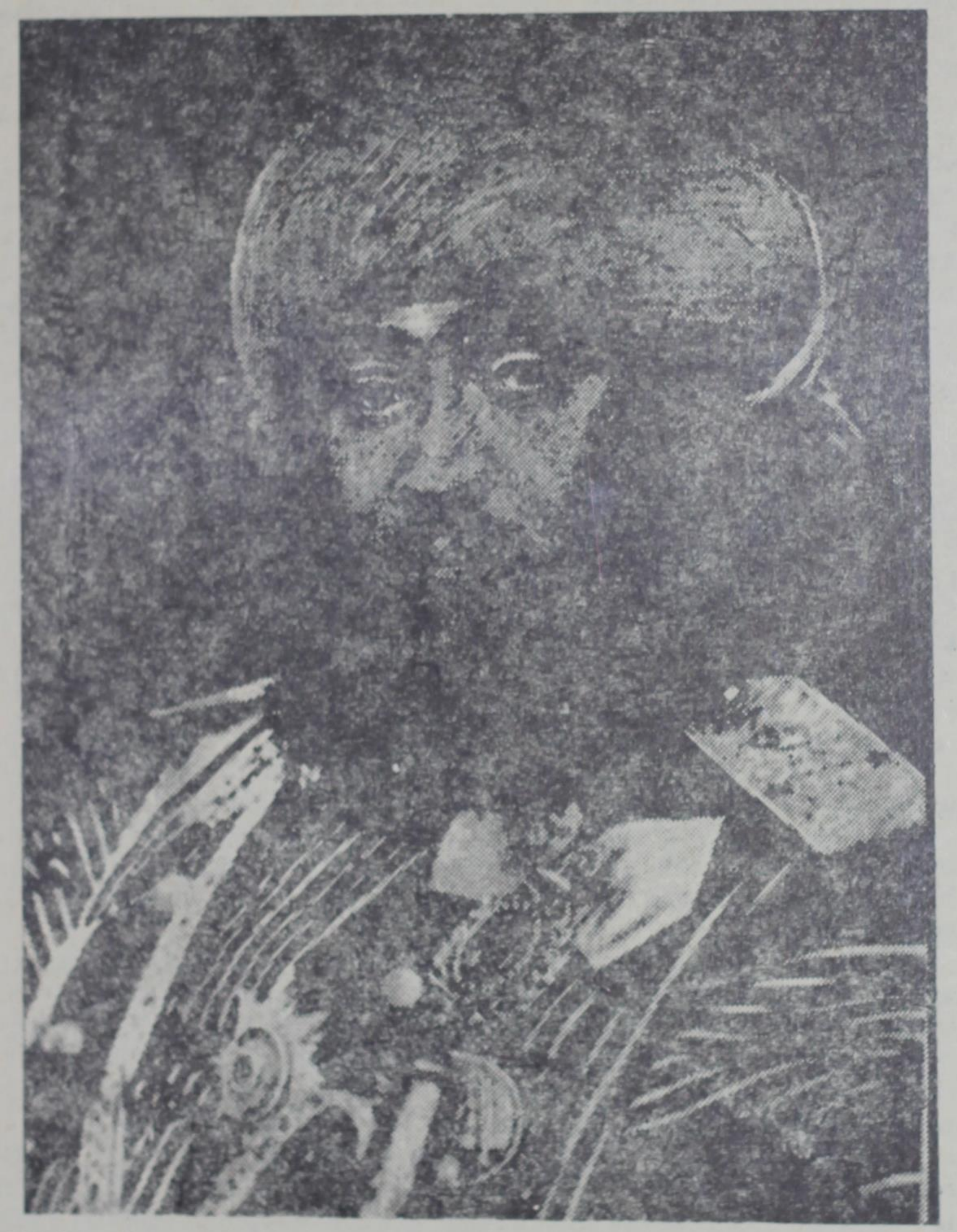
1903). Нихоят, акси ў дар хотирахои писараш Олимхон сабт гардидааст.

Акси Амир Олимхон зиёд бокй мондааст, ки мо яке аз он-