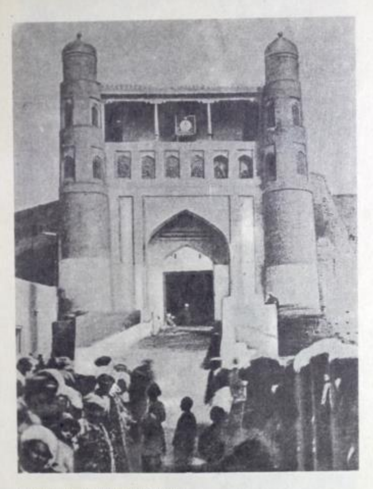
1. Арки салтанатии давлати Бухоро...