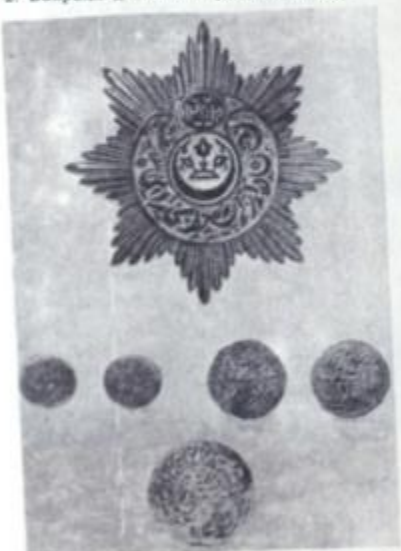
Герби савтанатия Бухоро. Сиккая тиллой. Зарби танга. Мукри давлатия амири Бухоро.