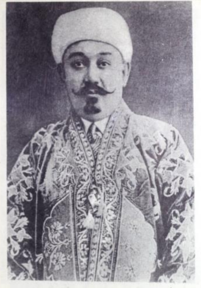
4. Ченерал Хочй Юсуф Мукимбой, вакили амири Бухоро.